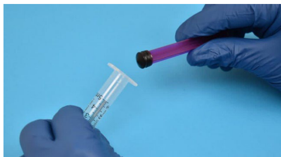
2. Wyciągnij tłok