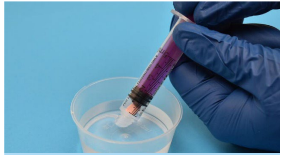
6. Pobierz 5 ml chłodnej przegotowanej wody