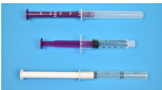
1. Przygotuj strzykawkę 5 ml

Omeprazol MUPS najłatwiej podać, stosując następującą technikę: