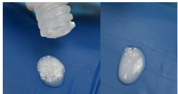
10. Każda kropla może mieć inną konsystencję. Jest to normalne