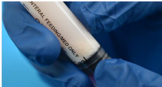
9. W płynie będą widoczne małe granulki. Jest to substancja czynna