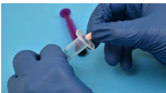
3. Umieść tabletkę MUPS w korpusie strzykawki