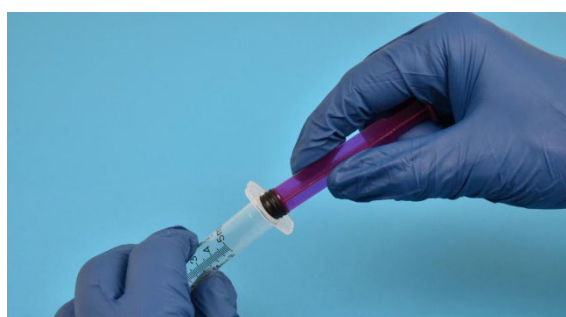
4. Włóż tłok z powrotem