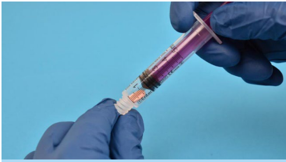
5. Wciśnij tłok aż do tabletki MUPS