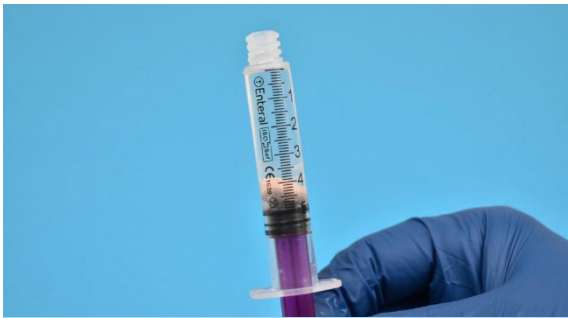
7. ظاهر اولیه MUPS در آب