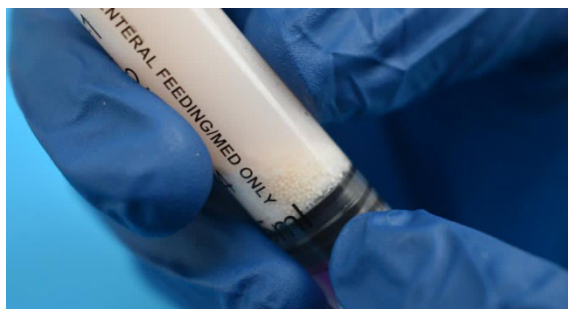
9. مایع گلوله های کوچکی در مایع خواهد داشت. این داروی فعال است